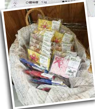
★ポケットティッシュ