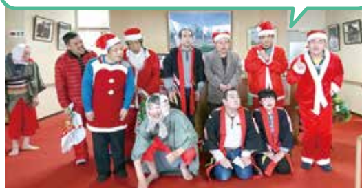
サンタクロース募金活動

銭太鼓、安木節を演舞し、サンタクロースになり募金活動をしました。ハラハラドキドキしながら利用者様の演舞をみっていますが、回数を重ねるごとに上手になり、拍手をたくさんいただいていたました。