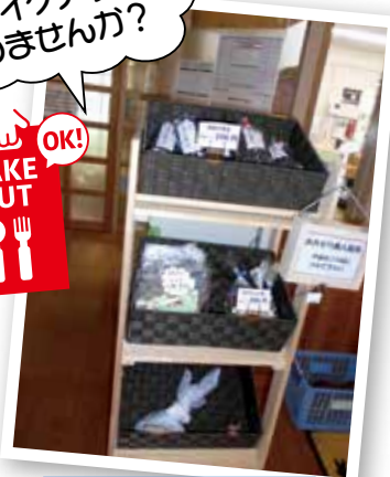
あおぞら無人販売