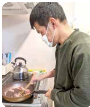
昼食作りも自分たちで!!