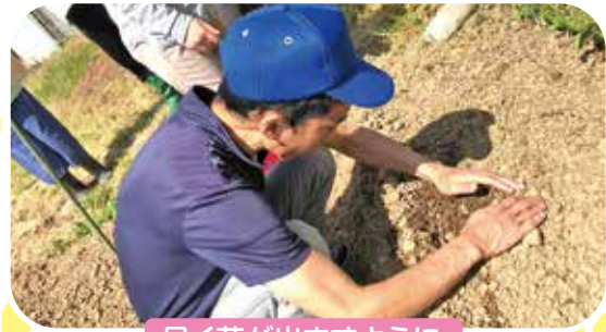
早く芽が出ますように