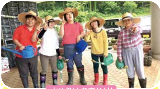
水やりはおまかせ!