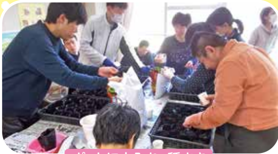
ポットに土入れ、種まき

今年も、お世話になっている皆様に、花椿で育てたひまわりをお届けする活動を始めました。 明るく輝くひまわりの花で、元気を届けたいと思っています!