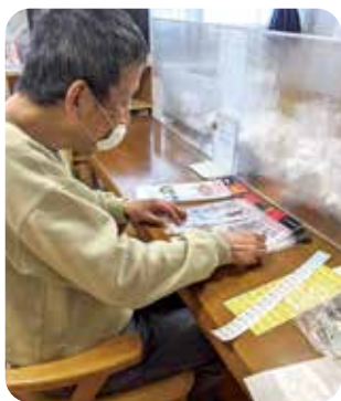
机を衝立で仕切り、マスク着用。ウイルス対策はばっちりです。