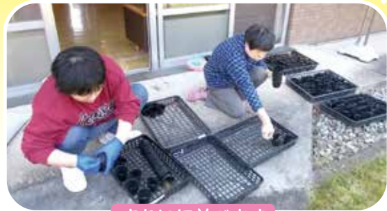
きれいに並べます